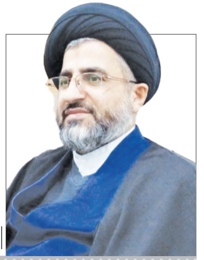
امام جمعه شهرستان محمودآباد:

مجمع خیرین محمودآباد برند انسان دوستی و دگر دوستی است