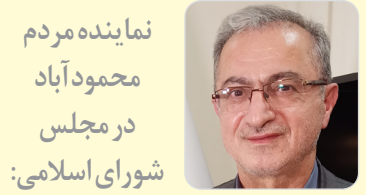
نماینده مردم محمودآباد در مجلس شورای اسلامی: